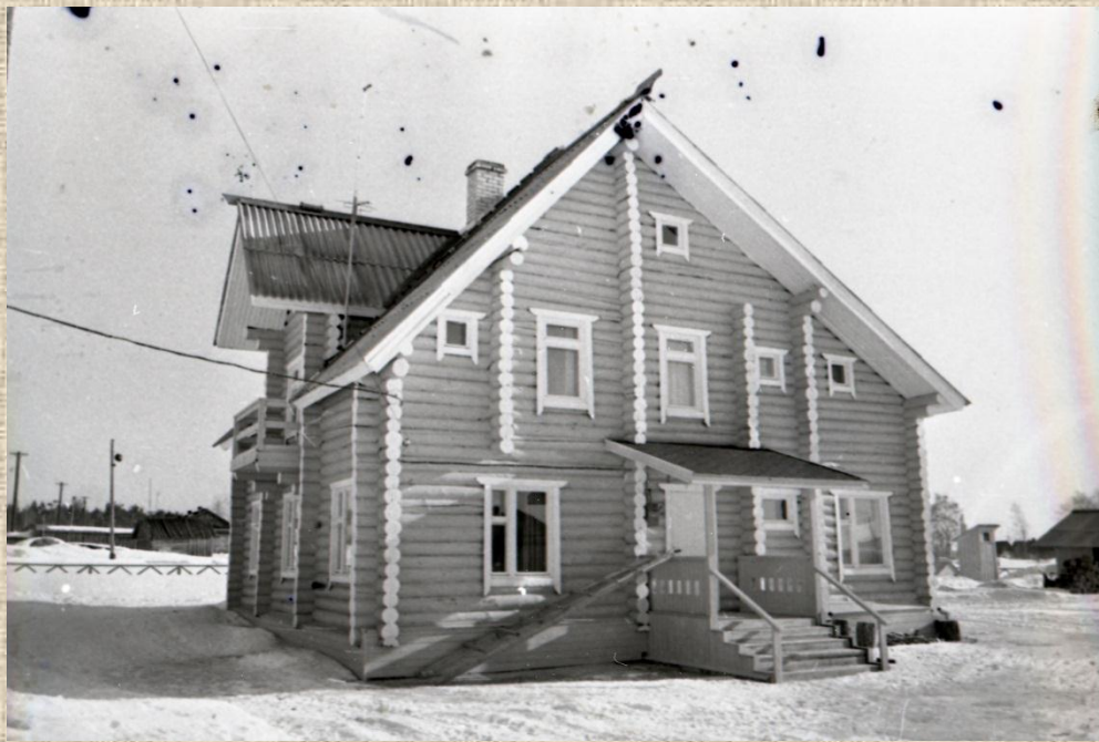
0-57321 Здание фельдшерско-акушерского пункта в д. Вокनावолок. Место съемки: Калевальский район. Дата съемки: 1998 г.