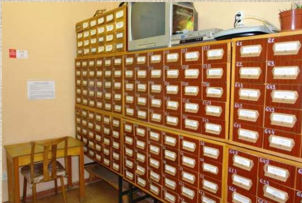
Дата съемки: 2013 г.