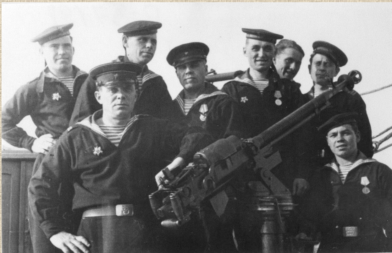
0-57198 Команда тральщика, потопившая тараном немецкую подводную лодку. Место съемки: г. Мурманск. Дата съемки: [1945].