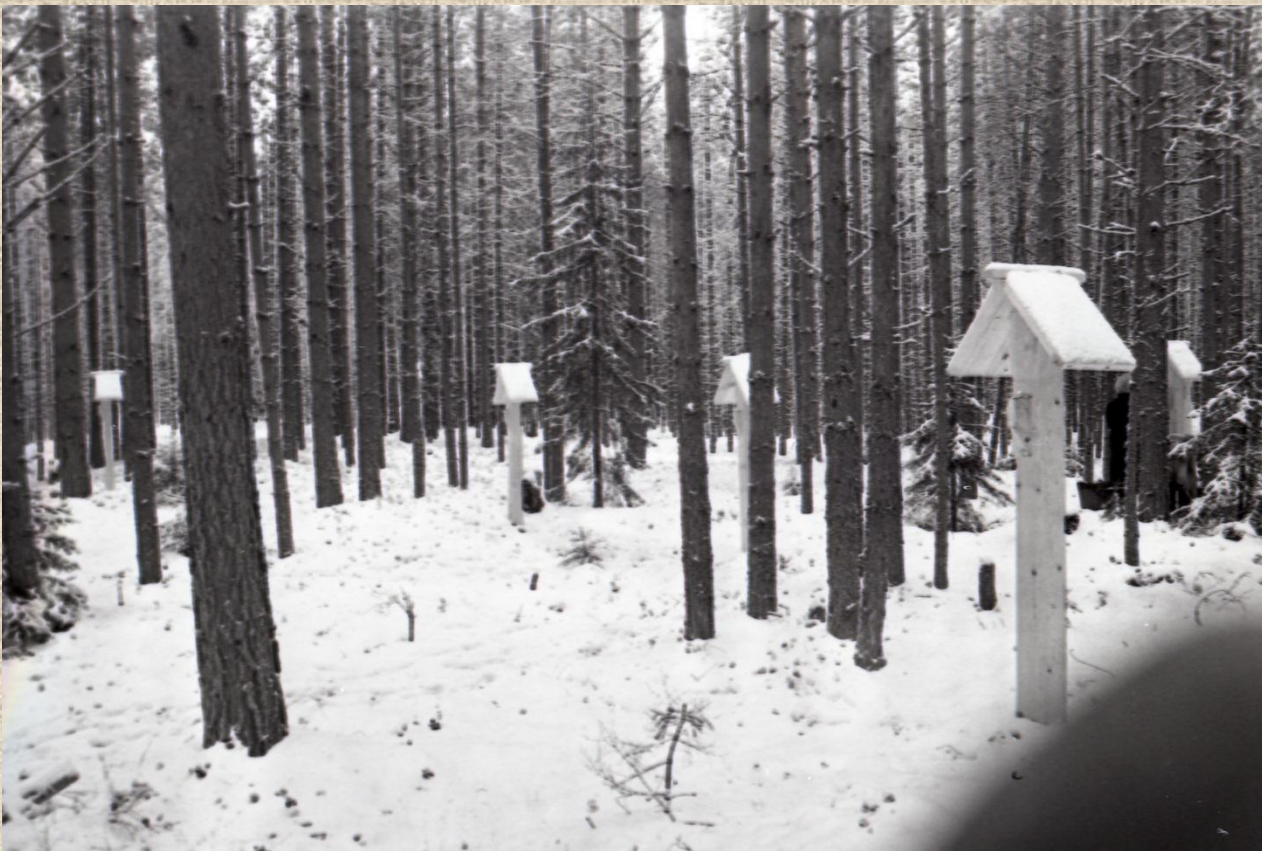
0-66653 [Надмогильные столбики] на Мемориальном кладбище «Сандормох». Место съемки: Медвежьегорский район. Дата съемки: 27.10.1997 г.