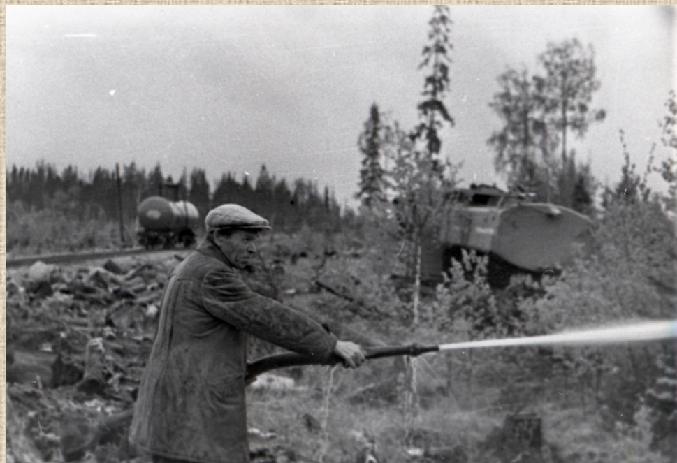
0-40840 На испытании нового пожарного оборудования в Суоярви леспромхозе. Место съемки: Суоярвский ЛПХ. Дата съемки: 1950-е гг.