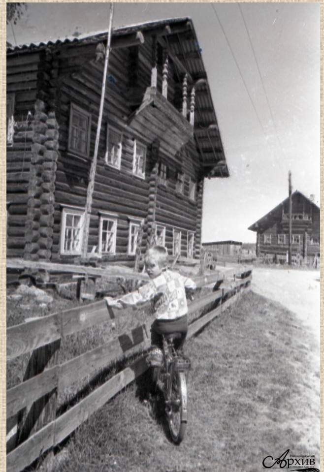
0- 56830 Деревня Кукойнваара. Место съемки: д.Кукойнваара, Пряжинский район. Дата съемки: 1994 г.