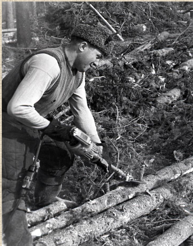
0-39758 Электрическая сучкорезка. Место съемки: не установлено. Дата съемки: 1950-е гг.