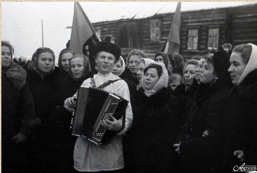
О-41112 Комсомольская свадьба в п. Ладва, свадебная процессия. Место съемки: п. Ладва. Дата съемки: 1969 г.