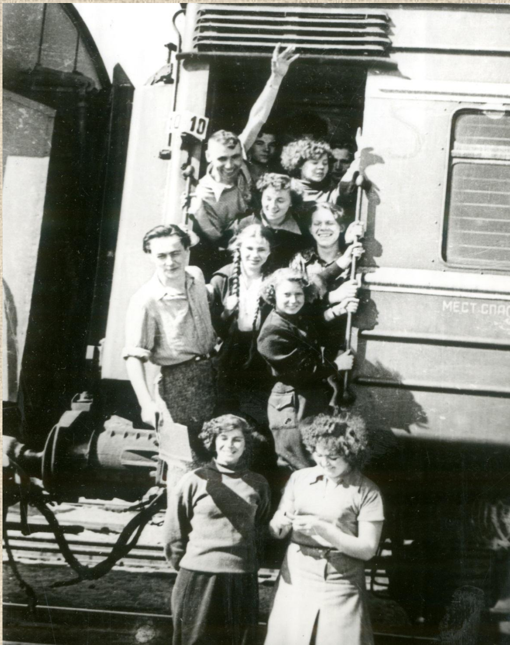
0-41063 Одна из групп комсомольцев-добровольцев, прибывших на строительство Западно-Карельской железной дороги. Место съемки: п. Суоярви. Дата съемки: 1956 г.