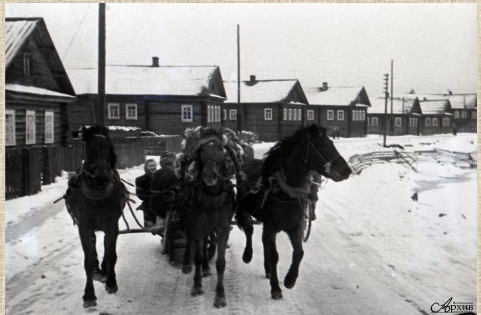
О-41113 На комсомольской свадьбе в п. Ладва. Место съемки: п. Ладва. Дата съемки: 1969 г.