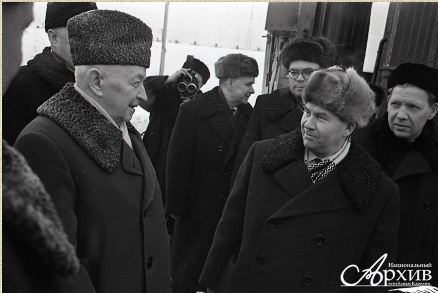
0-58217 Встреча на железнодорожном вокзале города Петрозаводска Отто Вильгельмовича Куусинена (слева), кандидата в депутаты Верховного Совета СССР от Карельской АССР, члена Президиума и секретаря ЦК КПСС. Справа - И.И. Сенькин, первый секретарь Карельского областного комитета КПСС. Место съемки: г. Петрозаводск. Дата съемки: 1962 г.